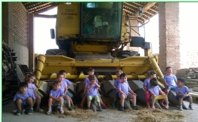
Centro Etnografico delle tradizioni contadine Il fontanile- Punto Parco Cascina Castello