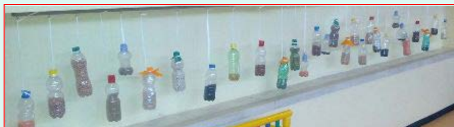
Percorso sonoro e tattile