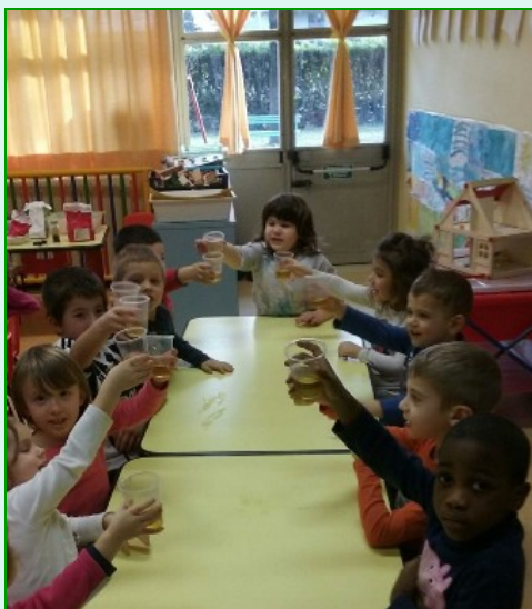
Spremuta di melagrana al profumo di menta..... una deliziosa merenda autunnale